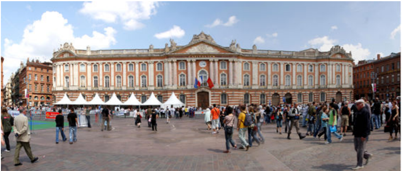
Un invité de marque : le soleil

Des stands d'informations seront ouverts au public toute la journée. Des responsables de clubs et des sportifs représenteront différents sports : aviron, basket, miniji, natation, plongée sous marine, ski alpin, ski nordique, tir à l'arc, tir aux armes et rugby fauteuil.